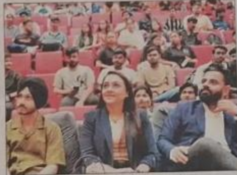
टेक फेस्ट में उपस्थित अतिथि व प्रतिभागी।

इस प्रतियोगिता में 600 टीमों ने पंजीकरण कराया है, जो विभिन्न थीम्स जैसे एआई, वेब-3, और स्मार्ट सिटीज पर आधारित प्रोजेक्ट्स पर काम कर रही हैं। इस हैकाथॉन में प्रतिभागियों को अपनी तकनीकी कौशल और समस्या-